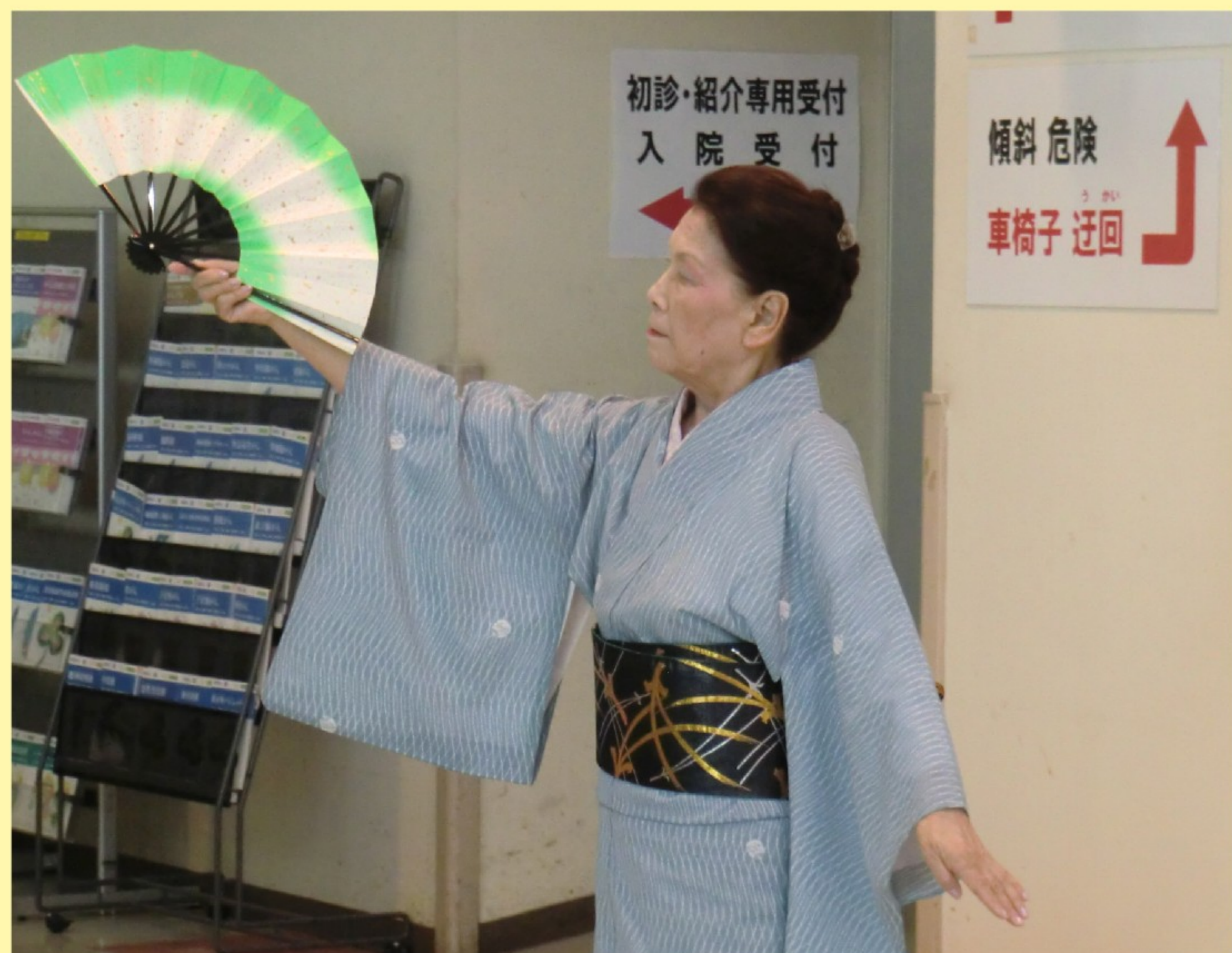
【写真】 前回のコンサートの様子

日にち 3月3日(火) 時間 15:00~15:40 会場 本館1階中央待合ホール